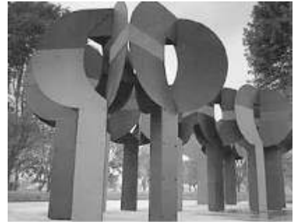
Obra: Edgar Negret

La contradicción generada por el cambio de modelo de sociedad y Estado generó levantamientos, guerras civiles y transformaciones sociales, dentro de ellas se dan las revoluciones liberales; inglesa 1.688; americana en 1.776 y francesa en 1.789. El triunfo de estos levantamientos instauro un nuevo orden basado en la concepción liberal del individuo: Todos los individuos son libres, dignos e iguales ante la ley. Todos los individuos son ciudadanos, con ello se le quitan los atributos a grupos sociales que les concedía el soberano. A la vez se constituye una nueva forma de ejercer poder social, la que se construye de abajo hacia arriba denominada democracia: la legitimidad del Estado esta en la soberanía popular, todo poder estatal procede del pueblo quien posee los derechos democráticos: elegir y ser elegido para ejercer el gobierno y la veeduría ciudadana.