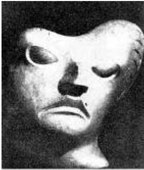
Obra: Edgar Negret

La política tributaria se basa en grabar todos los artículos de consumo, generalizando el IVA, aumentar los impuestos a los combustibles, gravar salarios y pensiones, estimular el cobro de impuesto predial, eliminar los subsidios a los estratos bajos para servicios públicos