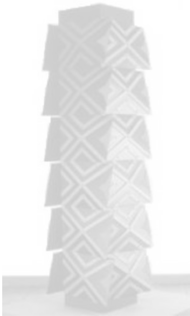
Obra: Edgar Negret