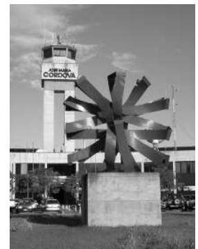
Obra: Edgar Negret

Desde la perspectiva económica, el modelo neoliberal se evidencia con la labor privatizadora y aperturista. Privatización de empresas como Telecom y las Telesociadas, venta de Bancafe y Granahorrar, cesión del 50% del gas de la Guajira a Chevron-Texaco, cesión por 18 años, del 50% del petróleo de Caño Limón a Occidental, venta de ECOGAS, la Refinería de Cartagena, las acciones de ISA, las acciones de Vecol, reestructuración de ECOPETROL, se ha liquidado una buena parte de la Red Pública Hospitalaria y liquidación y venta de las clínicas del ISS, Ley Forestal para ceder los bosques a las multinacionales.