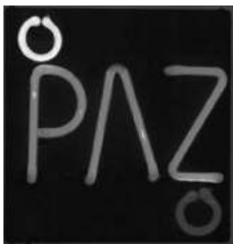
Obra: Edgar Negret

La formulación y de manera específica la realización de las políticas públicas, requiere guardar una coherencia en relación con la garantía de los derechos humanos, manteniendo entre sus principios la Universalidad, es decir que deben proteger a todos y a todas y no solo a grupos que se han considerado más afectados, dejando de lado la responsabilidad social del Estado con todos los ciudadanos. La integralidad considerada como la necesidad de satisfacer el conjunto de derechos y no solo algunos de ellos y la equidad vista como la equiparación de oportunidades ante las necesidades de cada sujeto y la disponibilidad y solidaridad de los que tienen mayores posibilidades.