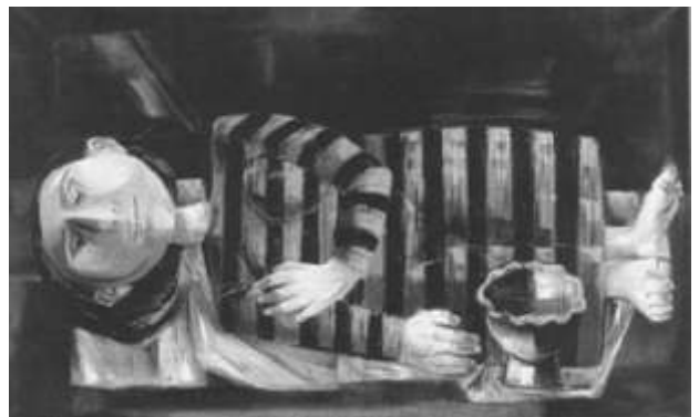
Obra: Enrique Grau