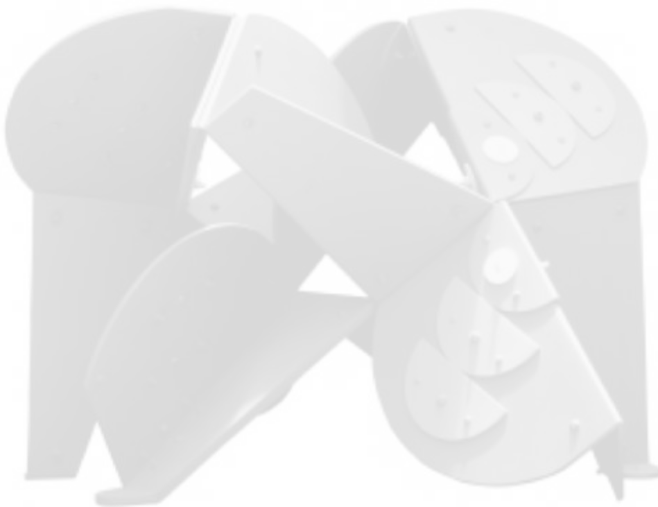
Obra: Edgar Negret