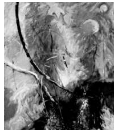
Obra: Enrique Grau

En el país del que procedo la generación de mis abuelos no había oído hablar jamás de planificación a largo plazo, de externalidades, de deriva de los continentes o de expansión del universo. Pero, incluso durante su vejez, continúan plantado olivos y cipreses sin plantearse problemas sobre los costes y los rendimientos. Sabían que tendrían que morir y que tendrían que dejar la tierra en buen estado para los que vendrían después de ellos, tal vez nada más que por la tierra en si misma. Sabían que, fuera cual fuera la potencia de que pudieran disponer no podían tener resultados benéficos mas que si obedecían a las estaciones, observaban los vientos y respetaban al imprevisible mediterráneo. No pensaban en términos de infinito y tal vez no habrían comprendido el sentido de esa palabra, pero actuaban, vivían y morían en un tiempo verdaderamente sin fin. Es evidente que el país todavía no se había desarrollado.