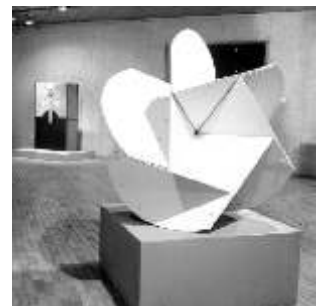
Obra: Edgar Negret

El Estado moderno está constituido por la división de los poderes en tres ramas denominadas del poder público: el Poder Legislativo, el Poder Ejecutivo y el Poder Judicial. Cada una de ellas tiene sus propias funciones, sus respectivas instituciones y se supone que ninguna de ellas manda a las otras. Pero todas deben regirse por la constitución.