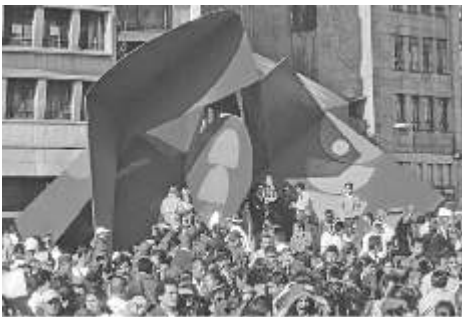
Obra: Edgar Negret

En esta forma de organización autocrática (El poder del Estado en una persona), la sociedad se organizaba de arriba hacia abajo a imagen y semejanza del soberano, quien por tradición, por el legado de su casta, era propietario de las tierras, las personas, las almas, el gobierno y el ejército. Dentro de este modelo de sociedad, el ciudadano con derechos sociales y políticos no existía. Los siervos, campesinos, artesanos y comerciantes tenían deberes de lealtad, respeto, obediencia y pago de impuestos a su soberano. Los dueños de tierras, duques, príncipes y demás, además de ser propietarios administraban los feudos del reino, poseían un poder político y económico dentro de las tierras de la corona.